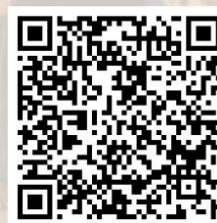
Planilha de Acompanhamento Permanente